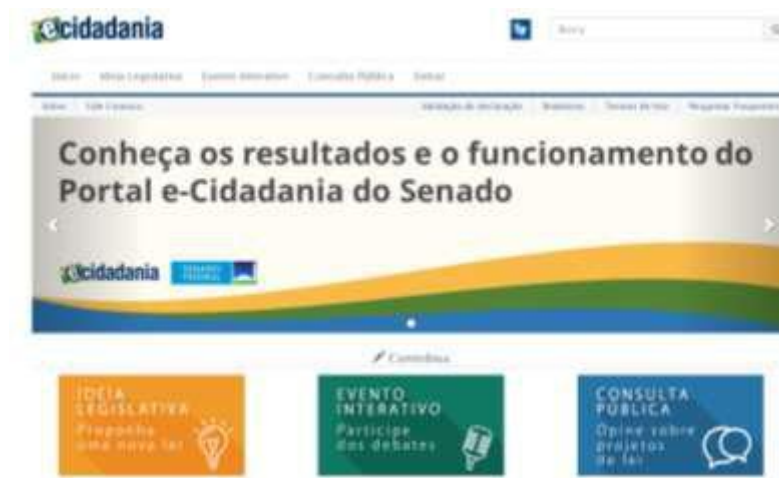
FIGURA 1 – PORTAL E-CIDADANIA DO SENADO FEDERAL