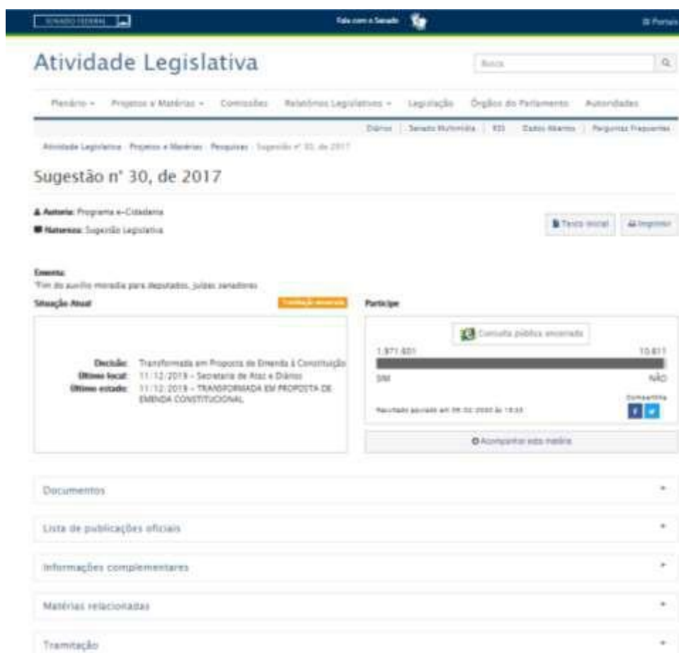
FIGURA 2 – INFORMAÇÕES SOBRE PROPOSIÇÕES LEGISLATIVAS – PORTAL DO SENADO FEDERAL