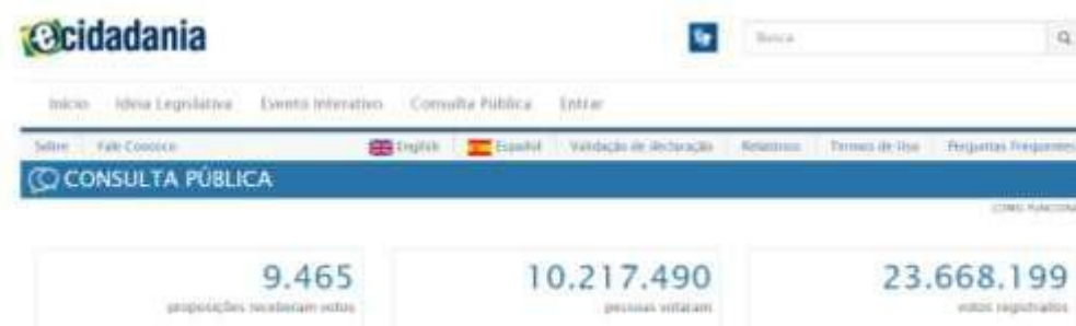
FIGURA 3 – TOTAL DE VOTOS NA CONSULTA PÚBLICA DO PORTAL E-CIDADANIA

10